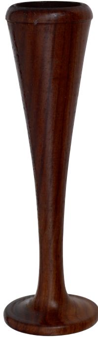
Holz Wooden Madera Legno