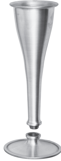
Aluminium Aluminium Aluminio Alluminio